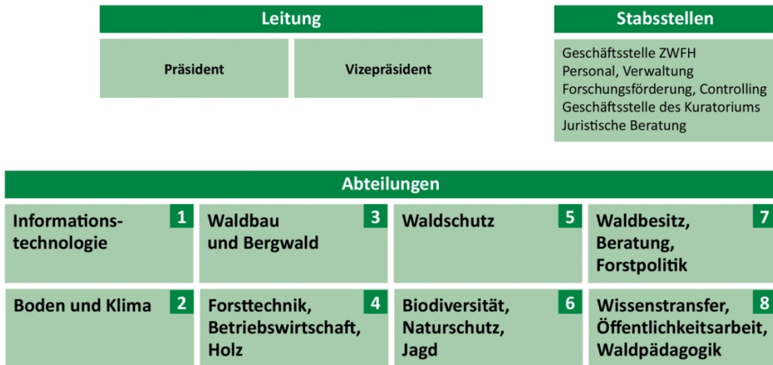
Abbildung 2: Organisationsstruktur der LWF seit 2011

Folgende Abbildung zeigt die aktuelle Struktur der LWF.